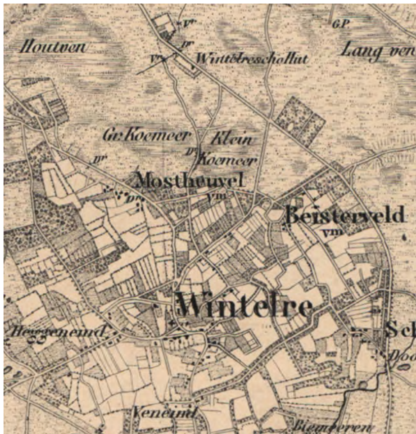
Situatie voor 1900: